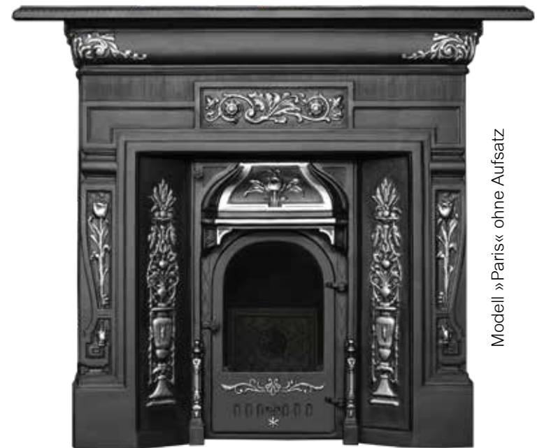
Modell »Paris« ohne Aufsatz

Das atemberaubende Design wird Sie begeistern und macht den Gusskamin zum absoluten Highlight Ihres Wohnzimmers. Sie erhalten diesen Blickfang mit und ohne gusseisernem Aufbau. Das Modell ist als offener oder geschlossener Kaminofen erhältlich.