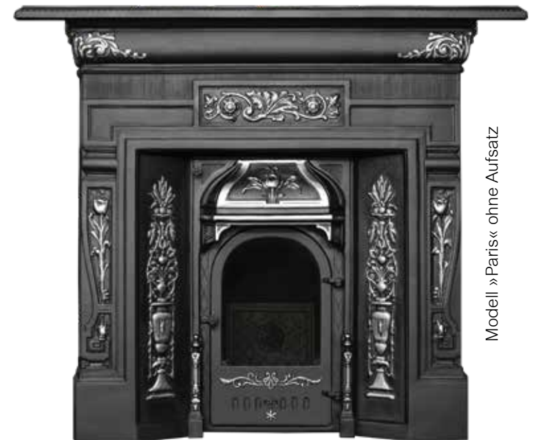
Modell »Paris« ohne Aufsatz

Das atemberaubende Design wird Sie begeistern und macht den Gusskamin zum absoluten Highlight Ihres Wohnzimmers. Sie erhalten diesen Blickfang mit und ohne gusseisernem Aufbau. Das Modell ist als offener oder geschlossener Kaminofen erhältlich.