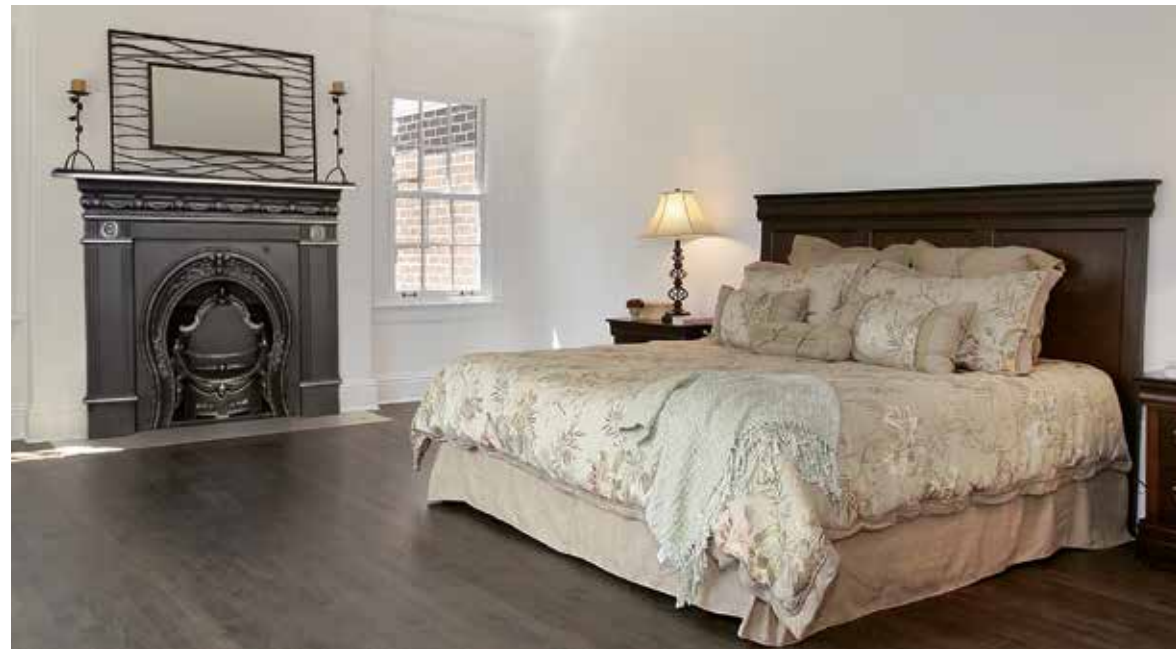
Modell »New York«